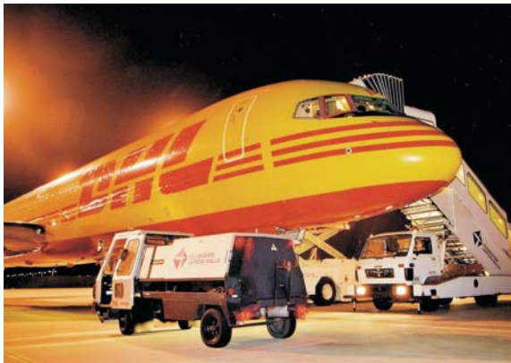
Eine Boeing 757 der DHL am Flughafen Leipzig/Halle

Die Post-Express-Tochter DHL verlagerte ihren Flugbetrieb von Berlin-Schönefeld nach Mitteldeutschland.