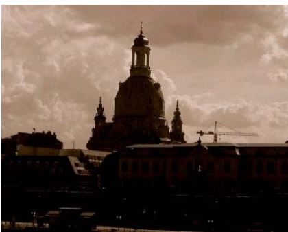
Eins der beliebtesten Touristikziele in Dresden – die Frauenkirche

In einem Vergleich rangiert die sächsische Landeshauptstadt mit 2,95 Millionen Übernachtungen zwar hinter Berlin und München aber noch vor Düsseldorf und Stuttgart sowie Leipzig. Mit 8,8 Millionen Gästen erzielte die Elbestadt im vergangenen Jahr ein Rekordergebnis. Das waren 12,8 Prozent mehr als ein Jahr zuvor.