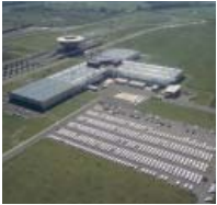
Das Porsche Werk in Leipzig wird ausgebaut

Dort wird das viertürige Sport-Coupé Panamera künftig hergestellt. Für dieses Fahrzeug, das 2009 auf den Markt kommen soll, wird die Porsche AG das Werk erheblich erweitern. Dabei entsteht eine neue Fertigungshalle mit einer Fläche von rund 25.000 Quadratmetern. Gleichzeitig wird die vorhandene Montagehalle um ein Pilot- und Analysezentrum sowie eine Lehrwerkstatt erweitert.