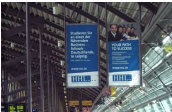
Zwei Banner werben in der Mall des Flughafens Leipzig/Halle für die Handelshochschule Leipzig (HHL)

Die Handelshochschule Leipzig (HHL) und die Mitteldeutsche Flughafen AG haben unlängst einen Kooperationsrahmenvertrag über dauerhafte Zusammenarbeit geschlossen.