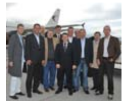
Die Delegation vor dem Abflug in LEJ

Der sächsische Außenhandel verzeichnete in den vergangenen Jahren zweistellige Zuwachsraten – die Russische Föderation nahm 2008 dabei den elften Platz in der Rangliste der wichtigsten Außenhandelspartner des Freistaats ein. Bei den Importen belegt Russland hinter der Tschechischen Republik sogar den zweiten Platz. Die Föderation wird auch nach Abklingen der Finanzkrise ein Boommarkt für mitteldeutsche Unternehmen bleiben. Zur Sondierung der aktuellen Entwicklung und Unterstützung sächsischer Unternehmen in Russland reisten führende Wirtschaftsvertreter des Freistaats am 8. Oktober zu einer dreitägigen Delegationsreise nach Moskau.