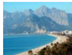
Touristisches Ziel Nr.1: Antalya