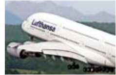
Leipzig/Halle gehört zu den Testflughäfen für den A380

Die Lufthansa will den regulären Flugbetrieb mit dem A380 im kommenden Sommer aufnehmen. Die Maschine absolvierte kürzlich ihren Jungfernflug und wurde bereits nach Hamburg überführt, wo nun Lackierung und Innenausstattung erfolgen.