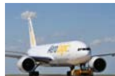
AeroLogic befördert künftig die Importfracht für Hermes