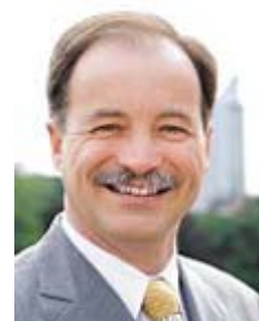
Der sächsische Verkehrsminister Sven Morlok (FDP)

Am 18. Oktober erfolgte der Startschuss für den weiteren Ausbau der A13. In zwei Bauabschnitten soll die Autobahn zwischen dem Dreieck Dresden-Nord und der Landesgrenze zu Brandenburg nun runderneuert und verbreitert werden. Während am Abschnitt zwischen Radeburg und Dresden-Nord noch geplant wird, begannen jetzt die Bauarbeiten am rund sieben Kilometer langen Abschnitt von Thiendorf bis zur Landesgrenze. Noch in diesem Herbst werden die Abholzungsarbeiten beginnen. Der Streckenbau wird Anfang 2010 erfolgen.