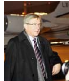
Nach der Ankunft am Airport eilte der Premier zu einem Gespräch mit Ministerpräsident Tillich

Kernpunkte des Gesprächs waren u.a. die Überwindung der Wirtschafts- und Finanzkrise sowie die Unterstützung von europäischen Schlüsseltechnologien im weltweiten Wettbewerb. Im Anschluss an das Gespräch besuchten Tillich und Juncker gemeinsam die Frauenkirche, wo der Premier zum Thema „Mit Sorge oder Vertrauen – Wie hat der Westen den Kollaps im Osten betrachtet“ referierte.