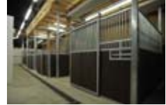
Der neue Stall in Kursdorf

Seit Ansiedlung der Lufthansa Cargo am Standort Leipzig/Halle und der Betriebsaufnahme der AeroLogic im Juli 2009 wurde ein erhöhter Bedarf zum Export von lebenden Großtieren, insbesondere Pferdetransporten, registriert. Damit die Tiere auch stets gut versorgt werden, nimmt zum 30. November am Flughafen ein 250 Quadratmeter großer Quarantänestall seinen Betrieb auf.