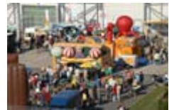
Tausende werden auf dem 5. Großen Flughafenfest erwartet

Am 11. Juli 1935 landete das erste Linienflugzeug in Dresden-Klotzsche – damit kann der Flughafen auf ein Dreivierteljahrhundert wechselvoller Geschichte zurückblicken. Am 18. und 19. September 2010 feiert er dieses Jubiläum mit dem 5. Großen Flughafenfest: An beiden Tagen stehen Rundflüge, Führungen, Flugzeugpräsentationen, Ausstellungen, Musik und Mitmach-Aktionen für Kinder auf dem Programm.