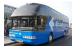
Der AutobahnExpress verkehrt nun viermal täglich zwischen LEJ und DRS

Und noch eine gute Nachricht: Seit dem 16. November fährt der AutobahnExpress zusätzlich von Leipzig direkt sowie vom Flughafen Leipzig/Halle über Halle Hbf. nach Kassel und Göttingen. Die Schnelllinie A14 verkehrt überhaupt erst seit Ende September 2009 – dies jedoch nach Angaben des Unternehmens mit „großem Erfolg“.